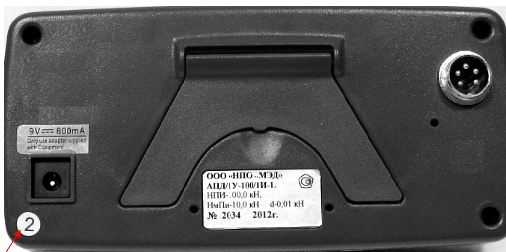
Схема пломбировки от несанкционированного доступа и обозначение места для нанесения оттиска клейма приведены на рисунке 9.

Место пломбировки от несанкционированного доступа