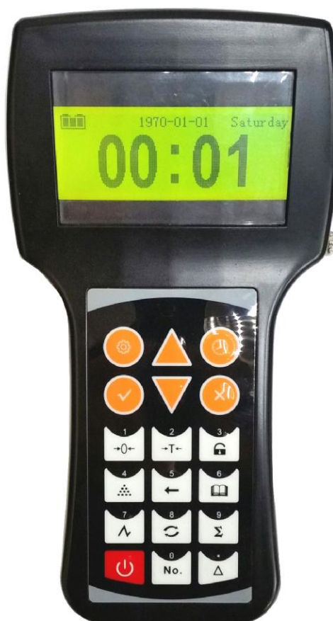
Рисунок 2 - Внешний вид электронного блока тип 2