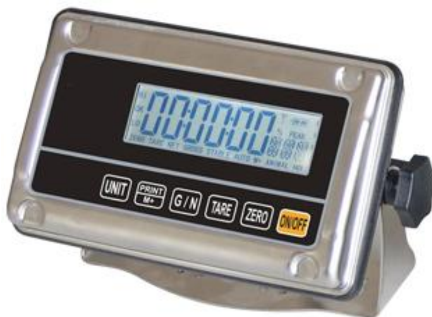
Рисунок 4 - Внешний вид электронного блока тип 4