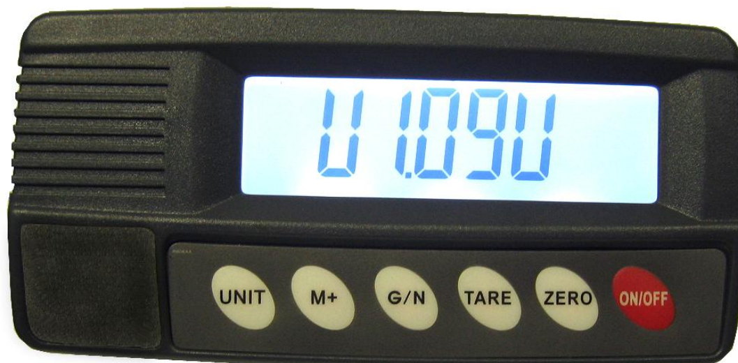
Рисунок 1 - Внешний вид электронного блока тип 1

Электронные блоки типов 1, 2 и 4 могут выпускаться, как в проводном, так и в беспроводном (дистанционном) исполнении. Внешний вид электронных блоков представлен на рисунках 1 - 6.