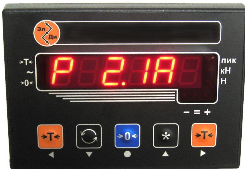
Рисунок 3 - Внешний вид электронного блока тип 3