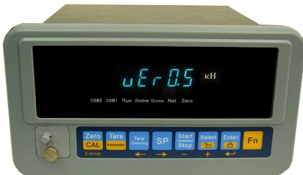
Рисунок 6 - Внешний вид электронного блока тип 6

Модификации динамометров отличаются видом измеряемой силы, наибольшими пределами измерений, классами точности, габаритными размерами упругих элементов и массой.