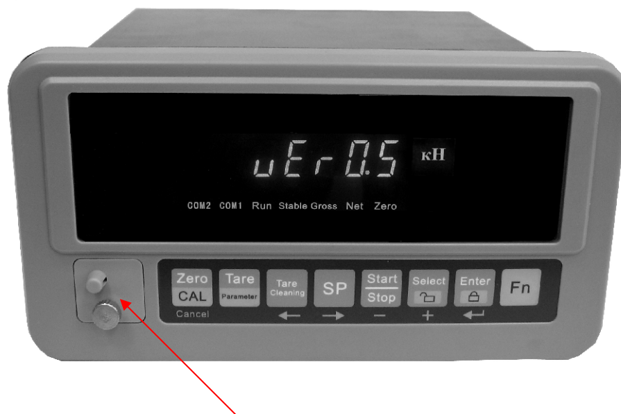
Место для нанесения оттиска клейма для электронного блока типа 6