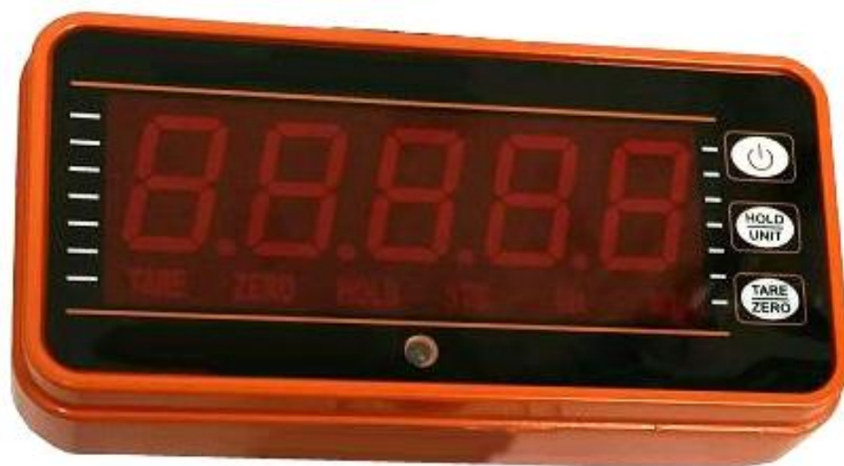
Рисунок 5 - Внешний вид электронного блока тип 5